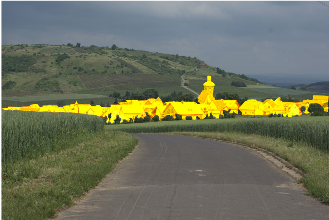
DUCHROTH ERSTRAHLT VOR DEM GANGELSBERG